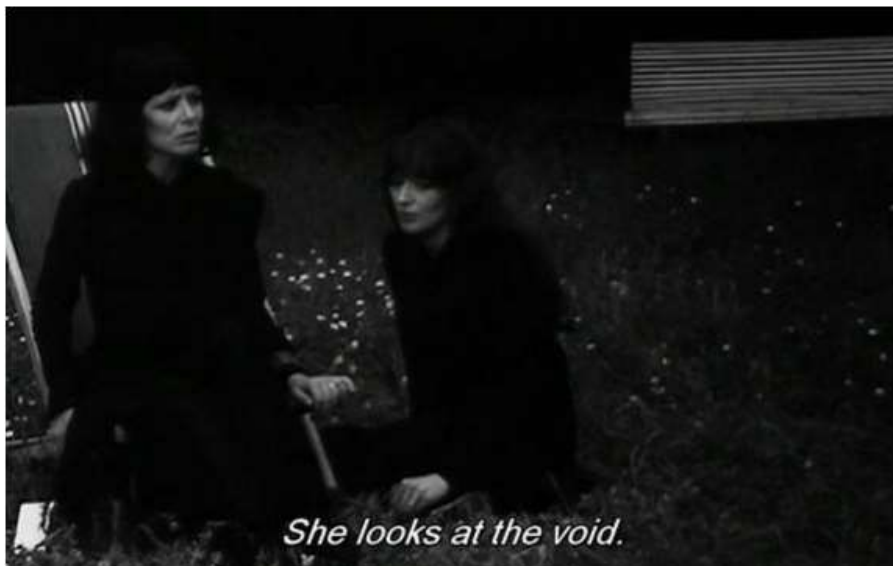
Scarlet Street (Fritz Lang, 1945) ft. Vernietigen, zegt ze (Marguerite Duras, 1969)